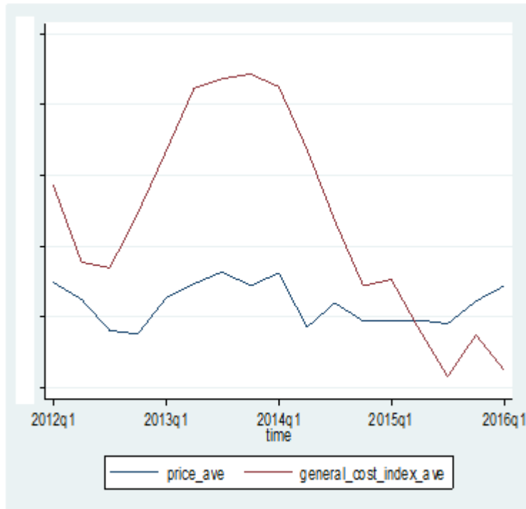
שנתות הציר האנכי הושמטו מטעמי סודיות