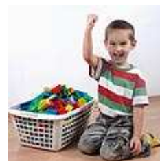
סמכו על היבואנים

"ברמת הבטיחות - אין פגיעה, כי אנחנו בודקים את סעיפי הבטיחות הקריטיים. מצד שני, השינויים הללו מאפשרים מסחר יותר קל בצעצועים. בהחלט, למכון התקנים תהיה פחות הכנסה מהבדיקות הספציפיות האלה".