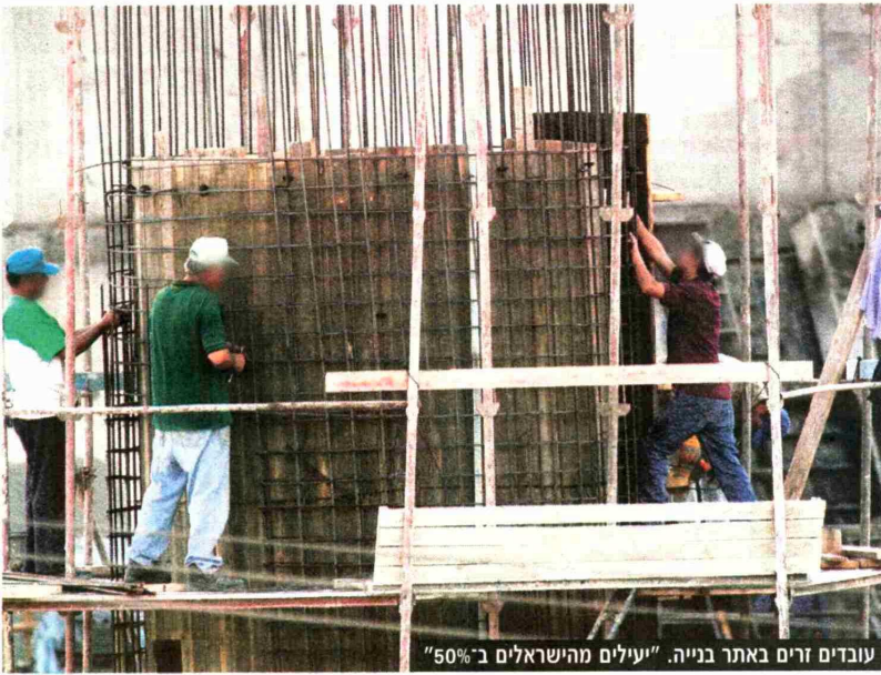
עובדים זרים באתר בנייה. "יעילים מהישראלים ב-50%"