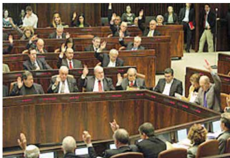
הצבעה במליאה על חוק ההסדרים בתחילת 2007

הכותב כיהן בכנסת ה-12 כיו"ר ועדת החוקה, חוק ומשפט ומכהן כנשיא איגוד לשכות המסחר