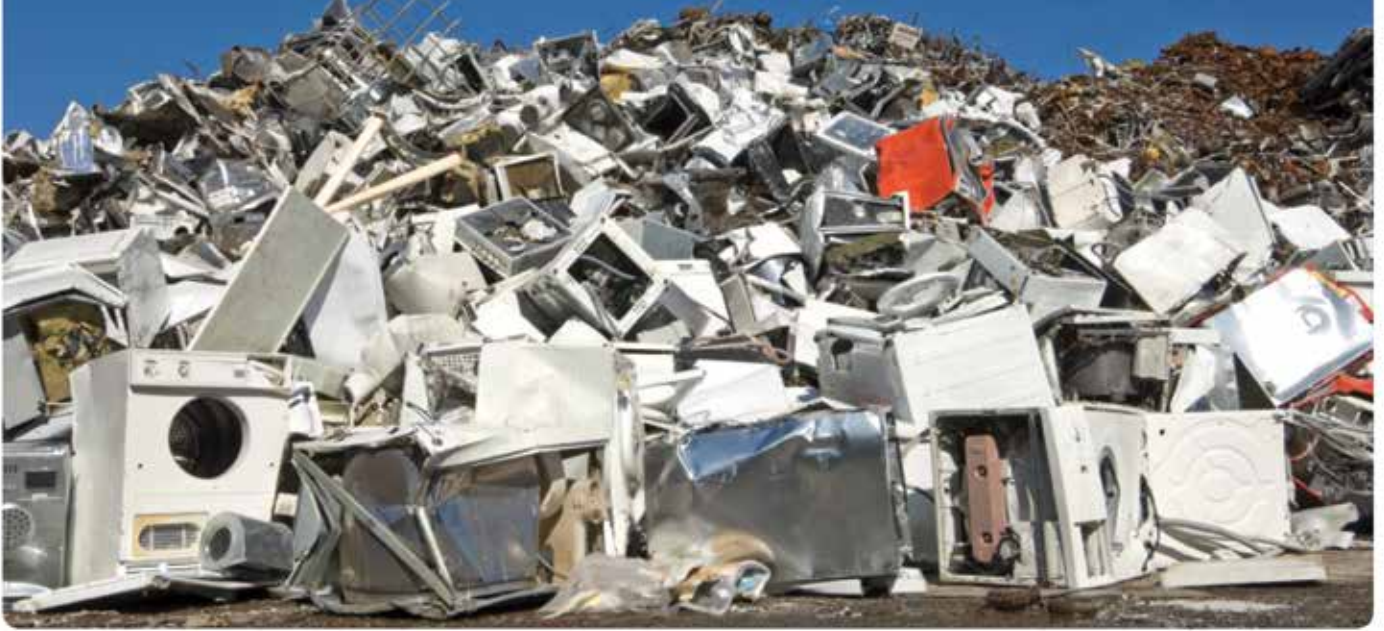
מכשירי חשמל במזבלה

אינם נמצאים כלל בחזקתו והוא לא היה זה, שלאחר 20 שנות שימוש הטיל מקררים מיושנים בריכוזי אשפה; ויבואן צמיגים, שייעודם הוא להחליף צמיגים שחוקים, המסכנים את בטיחות הנוהגים, הרי שגם הוא, לפי המשרד להגנת הסביבה, מזוהם את הסביבה. זאת למרות שהוא לא עשה שימוש באותם צמיגים, הם כלל לא נמצאים בחזקתו והוא לא זה שהשליך את הצמיגים הישנים.