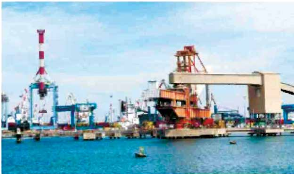
נמל אשדוד. הבעיה הגדולה היא שליטתם המלאה של הוועדים בנמלים

של כך עלינו להניח שלא נשיג דבר בהקדמת הנמלים החדשים במישור יחסי העבודה. זוהי הנחת עבודה שגויה ביותר. אפילו אם תנאי העבודה של העובדים בנמלים החדשים יהיו שווים לאלה שבנמלים הקיימים, עדיין תתקיים תחרות על רמת השירותים. גם העובדים הם בעלי יצר קיום, וכשהם יידעו שהאלטרנטיבה להשבתת עבודה תהיה הפניית העבודה לנמלים אחרים והפסדים עבורם, הם ינהגו על פי העקרונות המקובלים של ניהול ארגונים כלכליים בתנאי תחרות.