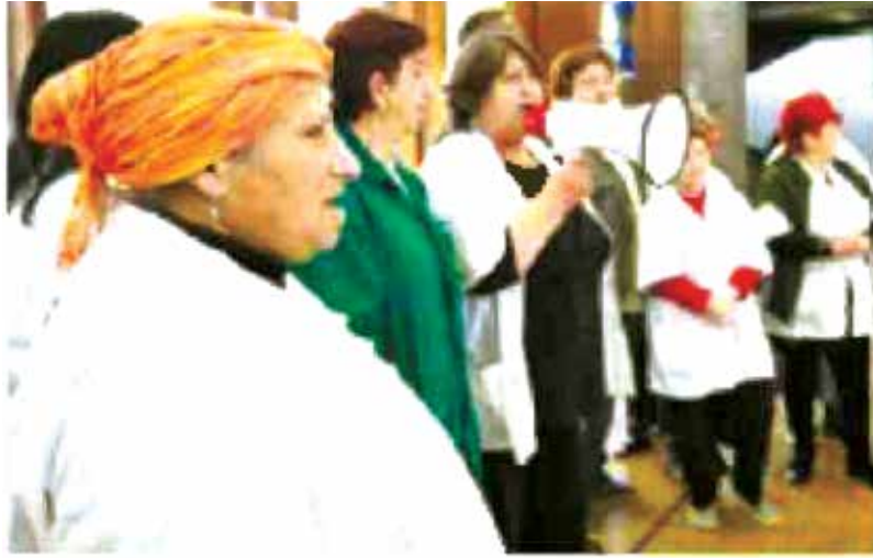
הפגנת עובדי קבלן. לא פחות מ-100 הצעות חוק מחכות לתורן

האכיפה בישראל מוטלת החובה לקיים את הוראותיו. אלא שכעת מבקשת הצעת חוק חדשה למנות עובר של המעסיק, שיהיה אחראי ישירות לביצוע החוק בכפיפות ישירה לרשות חיצונית, וזאת לאחר שכבר כיום המעסיק חייב למנות מקרב עובדיו נושאי משרה לשם ביצוע טוב יותר של החוק – ממונה על אבטחת מידע, אחראי על חוק למניעת הטרדה מינית, רכז נגישות על פי חוק שוויון זכויות לאנשים עם מוגבלות ועוד.