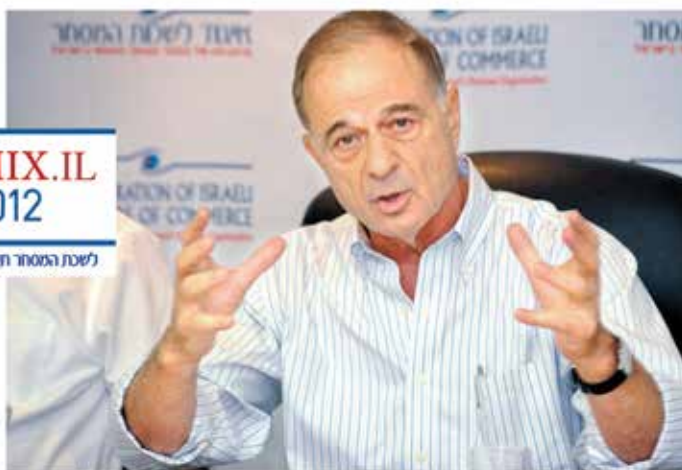
לין. "הספר מזמין ללמוד מהניסיון שלי"

"נכון, ומאחר שהמערכת הפוליטית מבינה בעיקר שפה פוליטית, ישבנו וניתחנו את המצב יותר לעומק, והסקנו שעתידם הכלכלי של 2 מיליון איש במדינה, שמתקיימים במישרין ובעקיפין מהמגזר הזה, הוא כוח פוליטי, ולכן נתחיל לגבש אותו ככוח כזה". ● אז בבחירות הבאות תפנה אל חברי האיגוד, לבעלי חנויות נעליים, יבואנים ובעלי משרדים, ותגיד להם למי להצביע? "אני לא אגיד להם למי להצביע, אבל בהחלט אומר להם למי לא, כלומר, אספר להם מי פוגע במהלכים שהוא מוביל באינטרסים שלהם שלא בצדק. הם מספיק נבונים כדי להבין במי לבחור ומה לעשות. מוטב שהמגזר העסקי יעביר למערכת