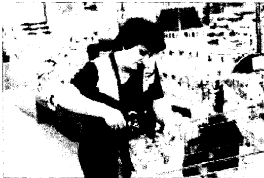
סופרמרקט בתל אביב. "השוק שרוי בחוסר ודאות"

למרות ההכנה המוקדמת שנעשתה על ידי רשות ההגבלים, בענף נותרו שאלות לא פתורות – למשל, לגבי קיום מבצעים מתואמים בין ספקים לרשתות. הספקים הקטנים: ההקלות לספקים גדולים יפגעו בתחרות