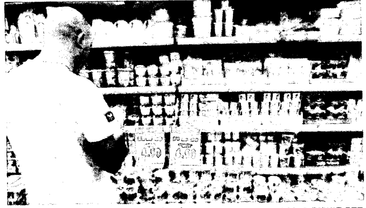
מדף מוצרים בסופר. ייקור בתעריפי המים לחקלאות