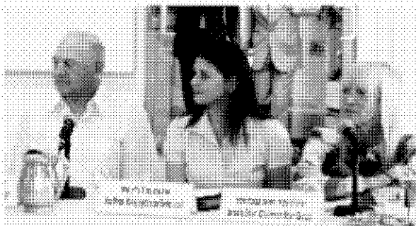
מסיבת העיתונאים של לשכת המסחר, אתמול

הפכו את כל בעלי העסקים בישראל לעבריינים פוטנציאליים. כולנו צריכים להיזהר בכל רגע מכך שאיזה חוק חדש יגרום לכך שביצענו עבירה. אי אפשר עוד להמשיך כך. בעלי העסקים בישראל הפכו לאויבי העם". כך טענו אתמול במסיבת עיתונאים אנשי עסקים מהותתיקים והמוכילים בארץ.